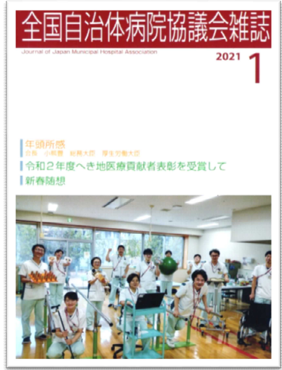
全国自治体病院協議会雑誌 2021年1月号にリハビリスタッフの写真が掲載されました

① 肺炎、無気肺、気胸② 肺がん、胸部外傷③ 慢性閉塞性肺疾患（COPD）、気管支喘息